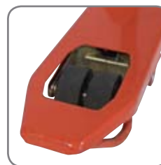
Die Zwillingsgabelrollen sichern optimale Drehbewegungen.