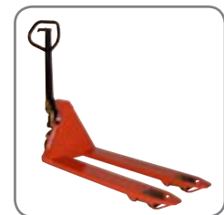
Panther Silent hat permanenten Schnellhub.