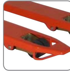
Gleitbügel an den Gabelspitzen ermöglichen ein einfaches und leichtes Hinein- und Herausfahren aus Paletten.