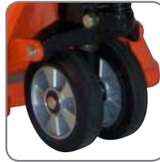
Spezielle Gummiräder schonen empfindliche Bodenbeläge und haben hervorragende anti-statische Eigenschaften.