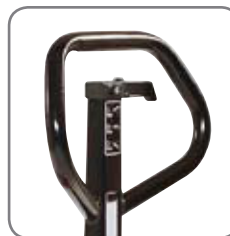
Die ergonomische Deichsel gewährt einen entspannten Griff.