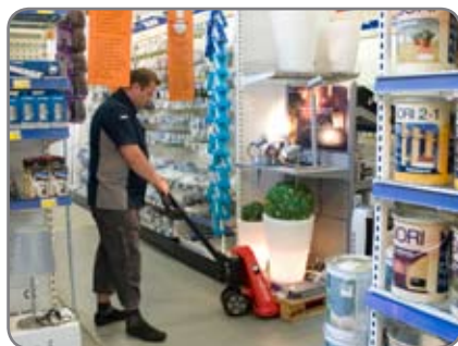
Auch in sehr schmalen Gängen können Güter problemlos transportiert werden.