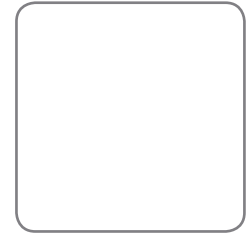
Firmennamen bzw. Logo des Kunden können im Dreieck des Wagens ausgeschnitten werden.