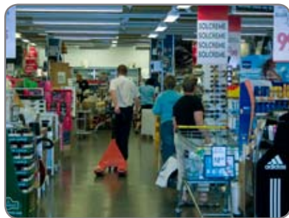
Panther Silent in einem Supermarkt, wo Komfort und Wohlbefinden der Kunden von großer Bedeutung sind.